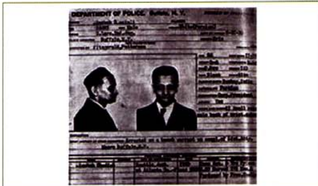
Figura 2. El cromoterapeuta Dinshah P. Ghadiali, sancionado a prisión y proscripción de ejercer su terapia pseudocientífica en el futuro (Nueva York, 1931).

Por otra parte, la bioenergética es una especie de psicoterapia "inventada" por A. Lowen en los años cincuenta del siglo pasado, que atribuye una importancia particular a "liberar la circulación de la energía en el cuerpo" 4 - y nos preguntamos; ¿cuál? ¿La bioenergía? Nadie sabe. Además, la bioenergética esta de alguna forma asociada al psicoanálisis, también muy popular en el siglo pasado, pero hoy también considerado una pseudociencia 5 .